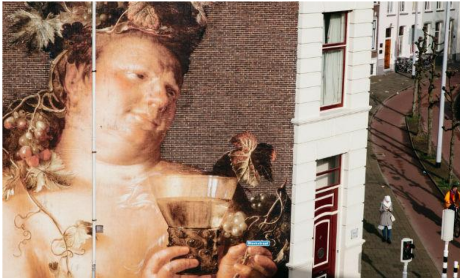
Werk: Bacchus (1628) door Joachim Wtewael Muurkunstwerk te vinden bij: kruising bij Catharijnesingel en Bleekstraat, Utrecht