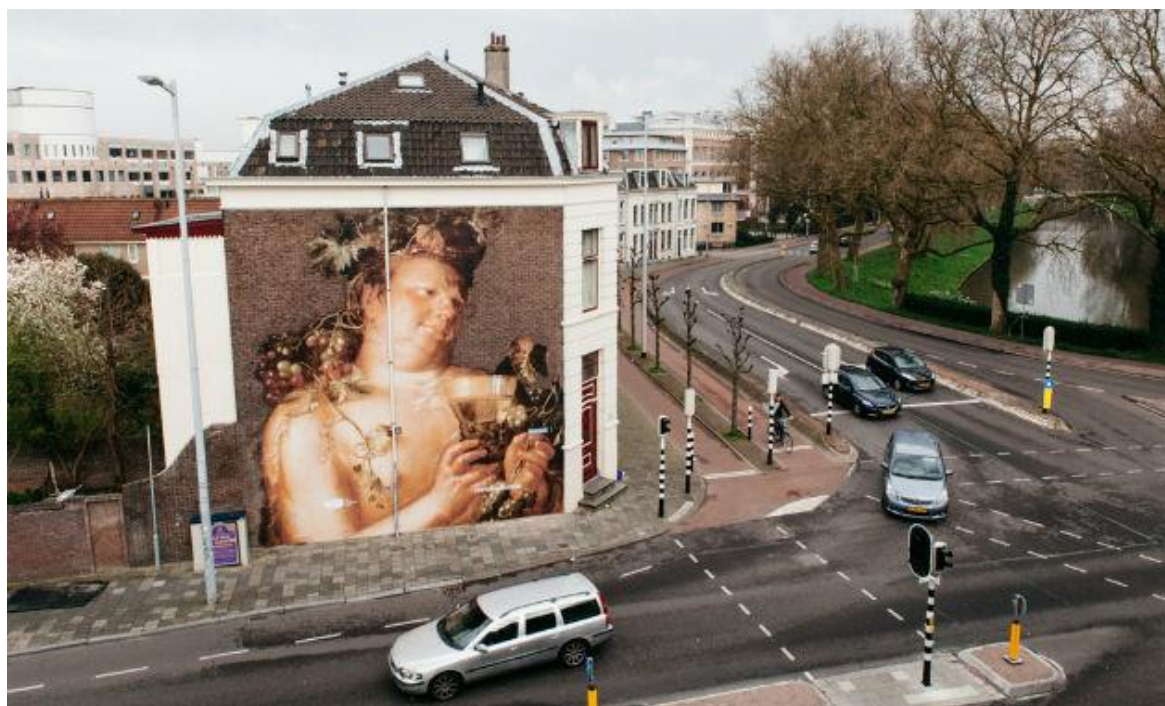
Muurtekening aan de Bleekstraat, schilderij Bacchus (1628) door Joachim Wtewael. Foto door

Unieke campagne ter promotie van opening vernieuwde museum