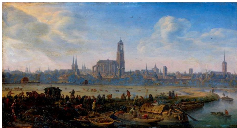
Herman Saftleven, Gezicht op de stad Utrecht , ca. 1664.

De succesvolle tentoonstelling Trots van de stad. De Utrechtse Domtoren is nog tot 2 oktober te zien in het Centraal Museum. Dit is de laatste kans om alles te weten te komen over hét symbool van de stad Utrecht. Waarom werd die toren eigenlijk gebouwd? En hoe ging dat in zijn werk? Waarom werd het middenschip van de kerk vernield tijdens de grote storm in 1674 en bleef de toren staan? In deze grote overzichtstentoonstelling in het Centraal Museum in Utrecht vind je alle antwoorden op deze en nog veel meer vragen.