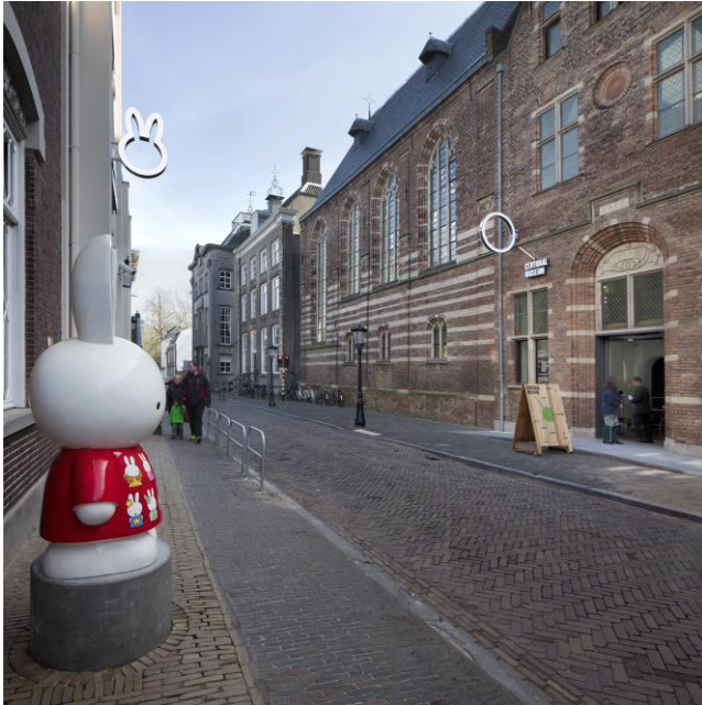
Centraal Museum. Foto Ernst Moritz