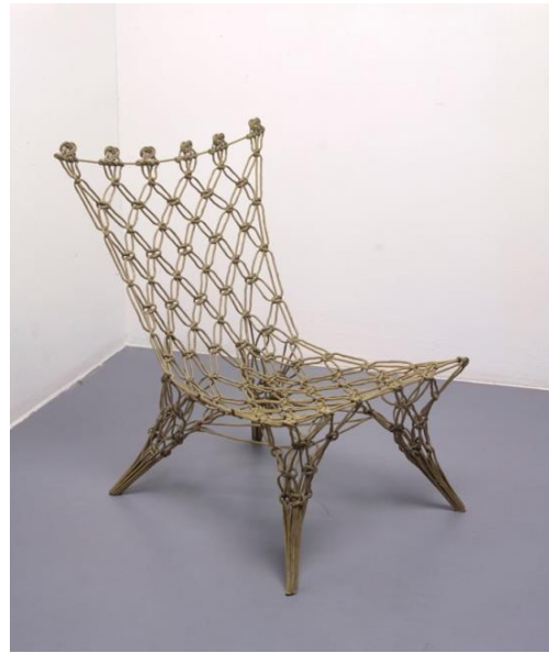
Links: Tejo Remy, You can't lay down your memory , 1991. Rechts: Marcel Wanders, Geknoopte stoel , 1995.

Het Centraal Museum kocht precies twintig jaar geleden voor het eerst werken van Droog Design aan. Momenteel bezit het Centraal Museum de grootste museale collectie Droog Design ter wereld. Bovendien viert Nederland in 2017 100 jaar De Stijl met het themajaar Mondriaan to Dutch Design . Een mooi moment dus om 50 hoogtepunten uit de collectie - inclusief recente aanwinsten - te presenteren in een verrassend vormgegeven presentatie.