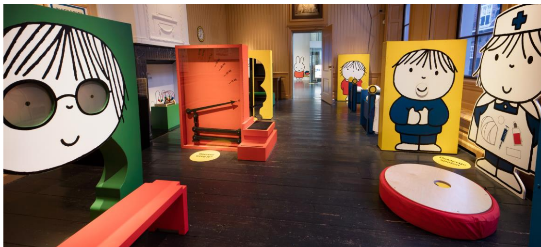
Nijntje museum