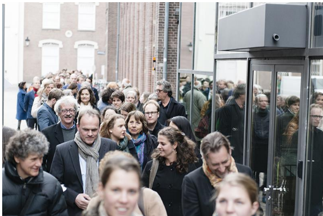
Feestelijke opening Centraal Museum

Het Centraal Museum heeft voor de komende jaren een ambitieus beleidsplan opgesteld. Dit plan is erop gericht om het aantal van 250.000 bezoekers per jaar structureel te borgen.